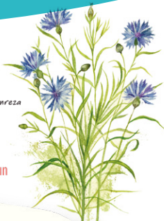
BleuetS - G. Manreza