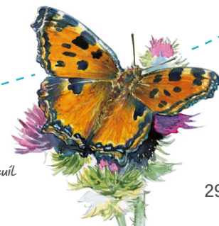
Papillon Demi-deuil F. Liéval