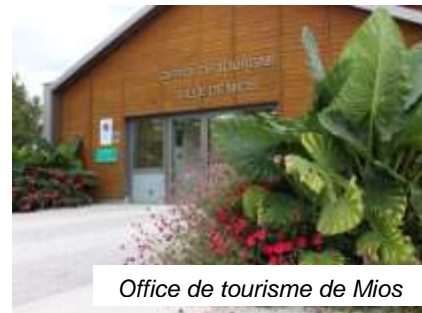
Office de tourisme de Mios

Le parcours débute à l'office de tourisme de Mios. Vous pouvez stationner sur les parkings qui se trouvent aux alentours.