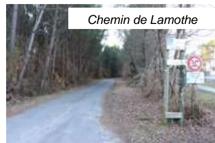
Chemin de Lamothe

Après avoir lu la planche graphique à l'entrée de la Zone Libellule, continuez tout droit sur environ 400 m, et, à la deuxième intersection prenez à gauche un chemin forestier en direction de la Leyre. Au bout, prenez de nouveau à gauche et suivez la rive en remontant vers le site d'accrobranche et son point d'accueil.