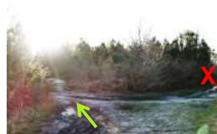
Chemin forestier permettant de rejoindre les rives de la Leyre

Depuis le site de l'accrobranche, vous n'avez plus qu'à remonter l'allée de la Plage jusqu'à l'office de tourisme pour retrouver votre point de départ.