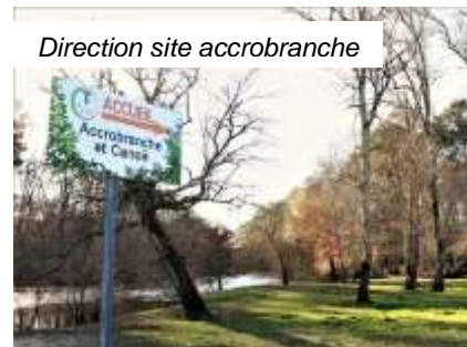
Direction site accrobranche

A la sortie de l'office de tourisme prenez à gauche l'Allée de la Plage menant à la Leyre. Au bout de l'Allée, prenez un sentier à droite menant à l'accrobranche « T en L'Eyre ». Passez une petite passerelle et rendez-vous devant l'accueil du site d'accrobranche. De là, suivez le petit sentier qui part dans la forêt sur votre droite. Au bout du chemin, vous arrivez à une intersection. Prenez sur votre gauche le Chemin de Lamothe (petite route se trouvant avant la piste cyclable), et continuez tout droit jusqu'à la « Zone Libellule ».