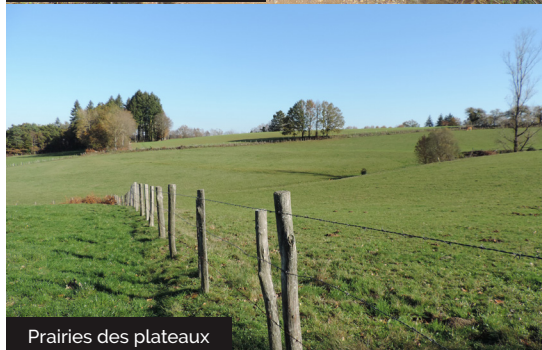
Prairies des plateaux

Embarquez vos randonnées en téléchargeant l'appli Vallée de la Dordogne - Tour .