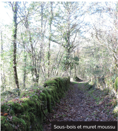
Sous-bois et muret moussu

Pour accéder au départ , prendre la route d'Aurillac et la sortie à droite, direction « L'Hospital ». Passer la zone d'activités du même nom, poursuivre jusqu'à un petit pont étroit à côté du moulin abandonné, se garer au bord de la Maronne, face à une grande maison.