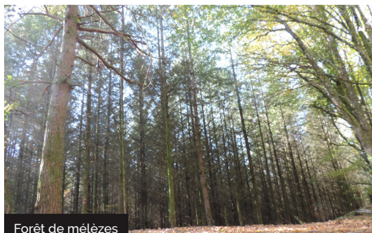
Forêt de mélèzes

Une randonnée avec une nature diversifiée : forêt de mélèzes, châtaigniers, sous-bois... Les forêts sont denses, la luminosité se fait timide en saison automnale sous le couvert des arbres. Ce qui offre un bel avantage par temps chauds. Surtout que le paysage ici impose des grimpettes, on sent déjà les prémices du Cantal voisin dans le relief de la Xaintrie. Sur les crêtes, des clairières et prairies, propices à l'élevage, offrent des vues dégagées sur des monts boisés, couverts de forêts denses et serrées. Ici, la forêt domine, majestueuse et omniprésente, au gré de quelques murets et granges rappelant l'activité humaine... L'habitat est typique de la Xaintrie avec des toits de lauzes, des granges et étables dans les hameaux aux habitations traditionnelles. Les abords de la Maronne, vive et sauvage clôturent le voyage pour finir au moulin en ruine de l'Hospital.