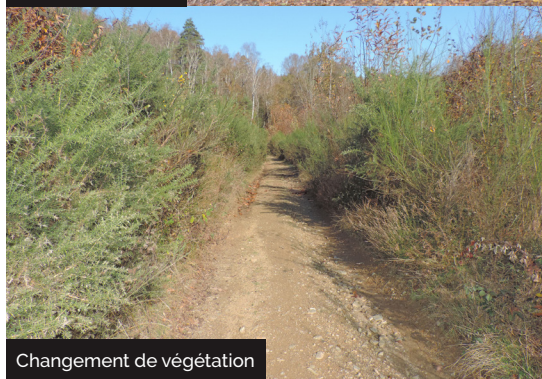
Changement de végétation