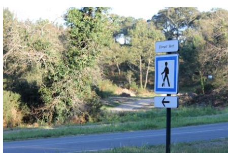
Départ du sentier vert