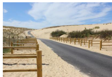
Entrée de la plage des Casernes