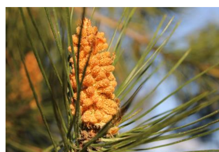
Une jeune pomme de pin