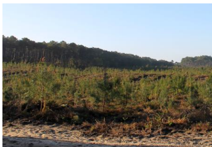
Jeune peuplement de pins