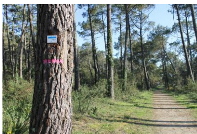
Balises du circuit