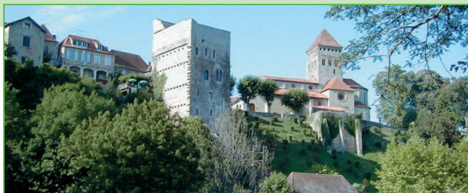
La tour Monréal et l'église de Sauveterre-de-Béarn.