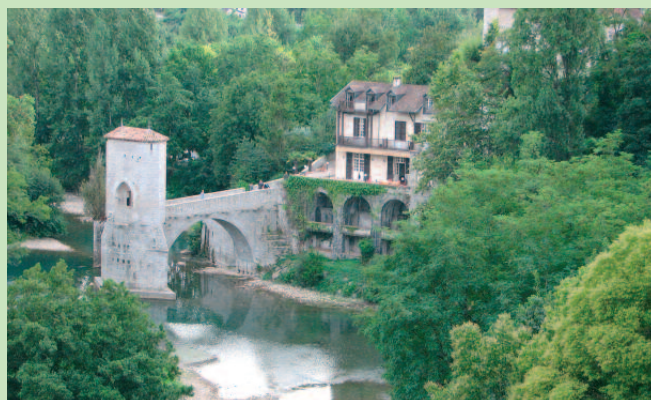
Le pont de la Légende.

C e chemin alterne entre histoire de la cité de Sauveterre et découverte du chemin de Saint-Jacques sur la voie de Vézelay.