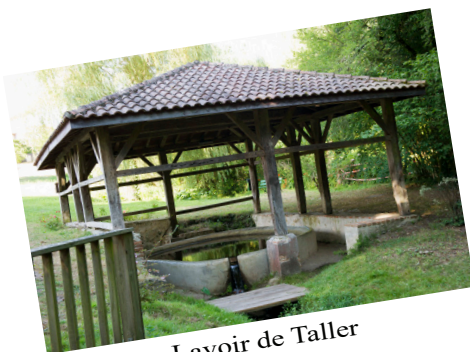
Lavoir de Taller

Taller est un petit village de charme situé un peu plus à l'intérieur des terres. Village d'histoire, Taller est cité dans l' « Itinéraire d'Antonin » et a été vraisemblablement traversé par Charlemagne et son neveu Roland pour rallier Roncevaux. Quelques années plus tard, il aurait été le théâtre d'affrontements sanglants entre des vikings venus voir si l'herbe était plus verte ici et les armées de Guillaume Sanche, duc de Gascogne. Un extrait de cartulaire des moines de Saint-Sever en fait état constatant que « longtemps après la bataille, il y avait encore dans cette plaine désertique [située juste au nord de Taller] plus d'ossements blanchis que d'herbes verdoyantes ». Preuve s'il en faut que l'herbe était très verte, dommage pour les vikings. Mais depuis, la nature a repris ses droits, laissant place à un cadre idéal pour les visites et les sorties de plein air. Son église du XVIème siècle, son lavoir ou encore sa salle de réunion construite sous le crayon d'Albert Pomade valent le détour.