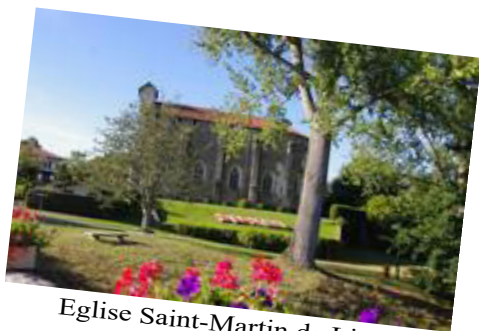
Eglise Saint-Martin de Linxe