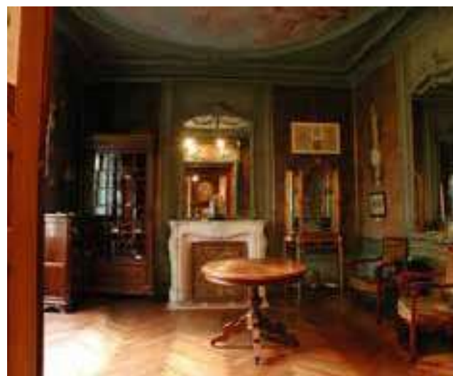
Salon du Musée Henri Barré

Continuez par la rue du Docteur Paul Verrier pour découvrir les maisons à pans de bois des XV e et XVI e siècles de la rue du Château.