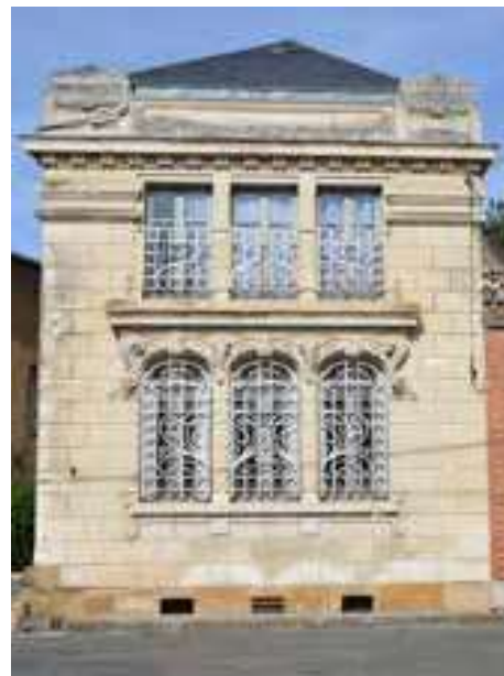
Façade Art nouveau

Avancez sur l'esplanade vers le monument des vétérans de la guerre de 1870 de l'artiste Charles Desvergnès 12 . Près du mur de soutènement, découvrez une cabine de bains, élément de l'œuvre de Corène Caubel « Souvenir d'une plage, Mythologie d'un possible littoral » 13 .