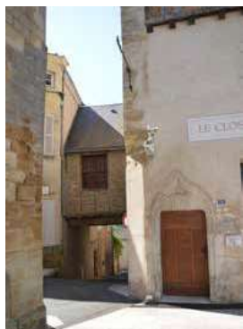
Ballet de la rue des Cosses

DÉPART DE LA MAISON DU THOUARSAIS OFFICE DE TOURISME DURÉE DU CIRCUIT SUD : 1H30