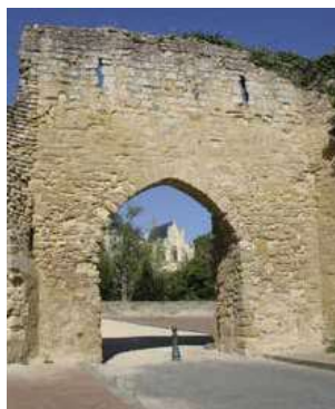
Porte Maillot à l'entrée du Pont des Chouans