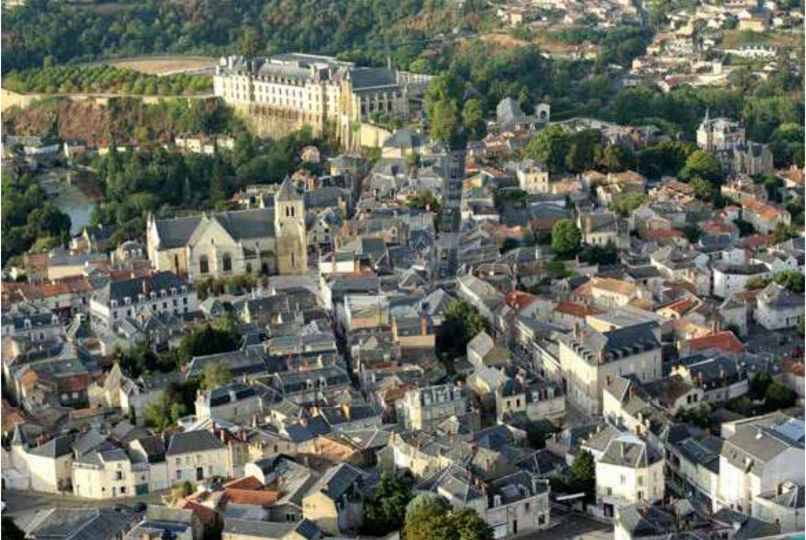
Vue aérienne du quartier Saint-Médard