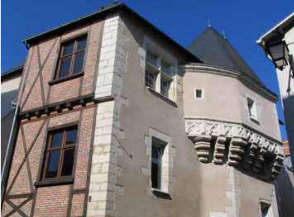
Hôtel des Trois Rois