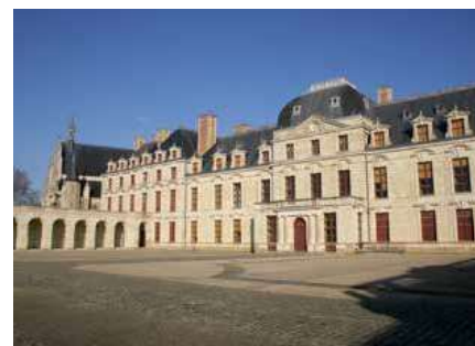
Cour d'honneur du Château des Ducs de La Trémoïlle