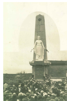
Inauguration du Monument aux morts 1922