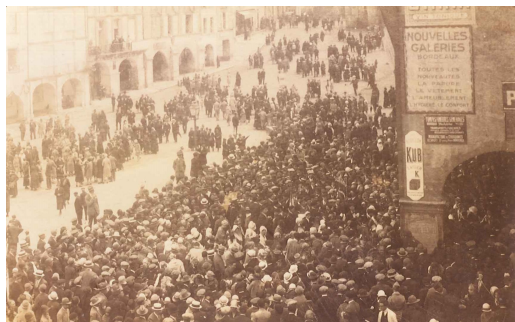
Fête de l'armistice le 12 novembre 1918

La Fête de l'armistice à Bazas le 12 novembre 1918