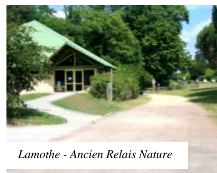
Lamothe - Ancien Relais Nature