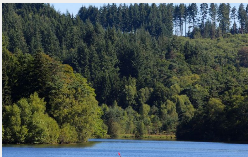
Étang de Meyrignac-l'Église

Vallée de la Vézère - massif des Monédières - Meyrignac-l'Église