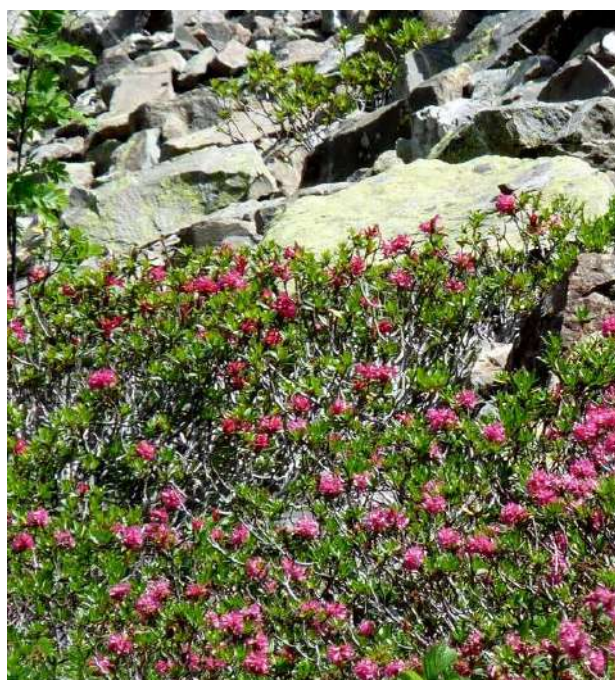
Rhododendrons dans les éboulis.

4 704088 E – 4756319 N Reprendre le même chemin pour la descente.