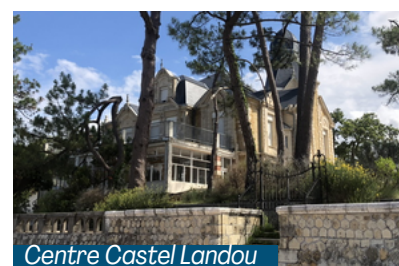
Centre Castel Landou