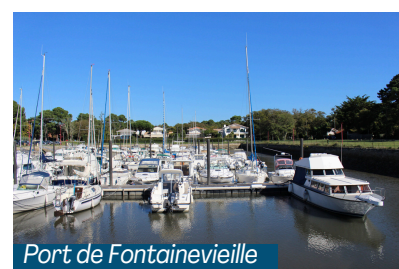
Port de Fontainevieille