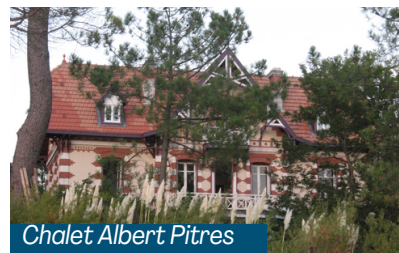
Chalet Albert Pitres