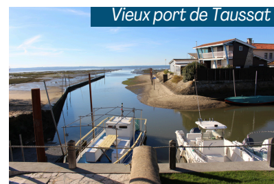
Vieux port de Taussat