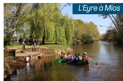
L'Eyre à Mios