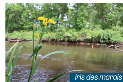
Iris des marais