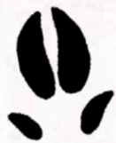
Trace de sanglier

Balade idéale en famille sur des chemins sablonneux, à travers bois de pins, landes et genêts.