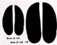
Trace de cerf