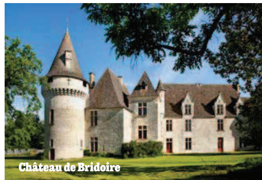
Château de Bridoire

Inkatas © 2022 OpenStreetMap.org et contributeurs