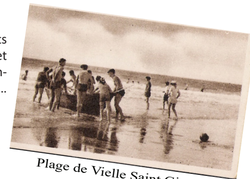
Plage de Vielle Saint Girons

« Si le chef-lieu du département des Landes, Mont de Marsan, est appelé la ville aux trois rivières, on pourrait appeler Linxe, la commune aux six ruisseaux » (Linxe, un village en Maren-sin – Groupe Linxois PAC Euréka). Lieux de détente depuis toujours, ces points d'eaux et les petits lacs qui vont avec sont constitutifs d'un environnement recherché pour sa quiétude. A Linxe, on peut aussi être agréablement surpris par la présence de grandes demeures bourgeoises appelées «châteaux» à proximité. Avec les quelques maisons à colombage du centre-bourg et les aïrials des quartier extérieurs, ils composent une certaine diversité architecturale très plaisante.