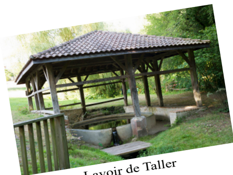
Lavoir de Taller