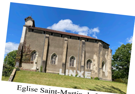
Eglise Saint-Martin de Linxe