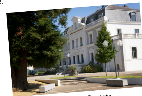
Mairie de Castets