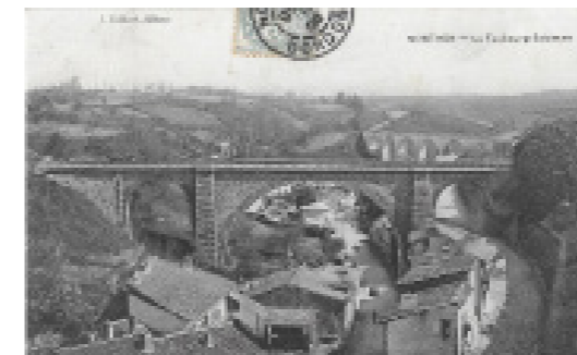
Carte postale ancienne de Nontron

Nontron Les cartes postales anciennes de Nontron montrent le paysage d'hier. Les coteaux bien que boisés à certains endroits, étaient toutefois cultivés et pâturés. Les panoramas sur la ville posée sur un éperon rocheux étaient plus dégagés qu'aujourd'hui.