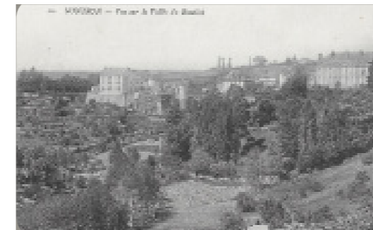
Carte postale ancienne de Nontron