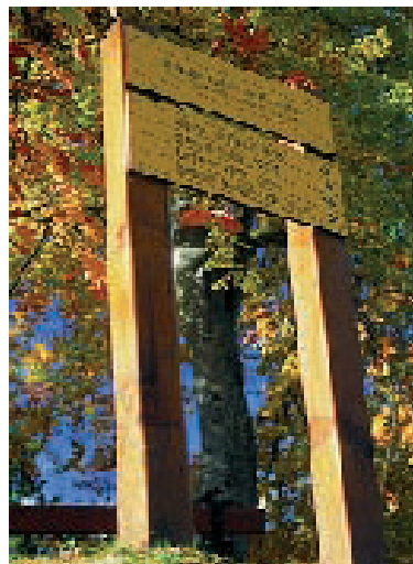
Señalización de los senderos

Duración del recorrido: La duración de cada circuito se ofrece a título indicativo. Tiene en cuenta la longitud del recorrido, los desniveles y las eventuales dificultades.