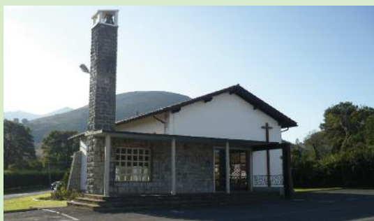
La chapelle d'Olhette

L e trajet proposé est un aller-retour qui part de la chapelle d'Olhette pour aller à la venta d'Intsola. Promenade tranquille dans des ambiances forestières variées, pour flâner en famille le long du chemin.