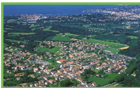
Vue aérienne d'Urrugne

Au centre du village, l'église massive de Saint-Vincent présente sur le cadran solaire la devise : « VULNERAT OMNES, ULTIMA NECAT » (toutes les heures blessent, la dernière tue). Sur la place, on remarque la Mairie, parmi les plus belles maisons labourdines du bourg.