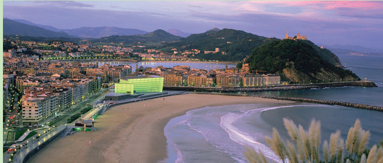
Donostia – San Sebastián

NIV 2 FÁCIL DE PASAIA A DONOSTIA – SAN SEBASTIAN