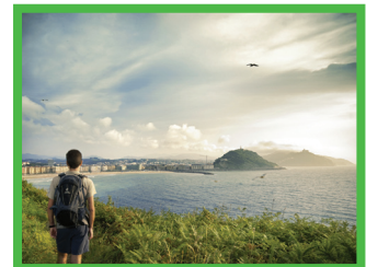
Donostia – San Sebastián