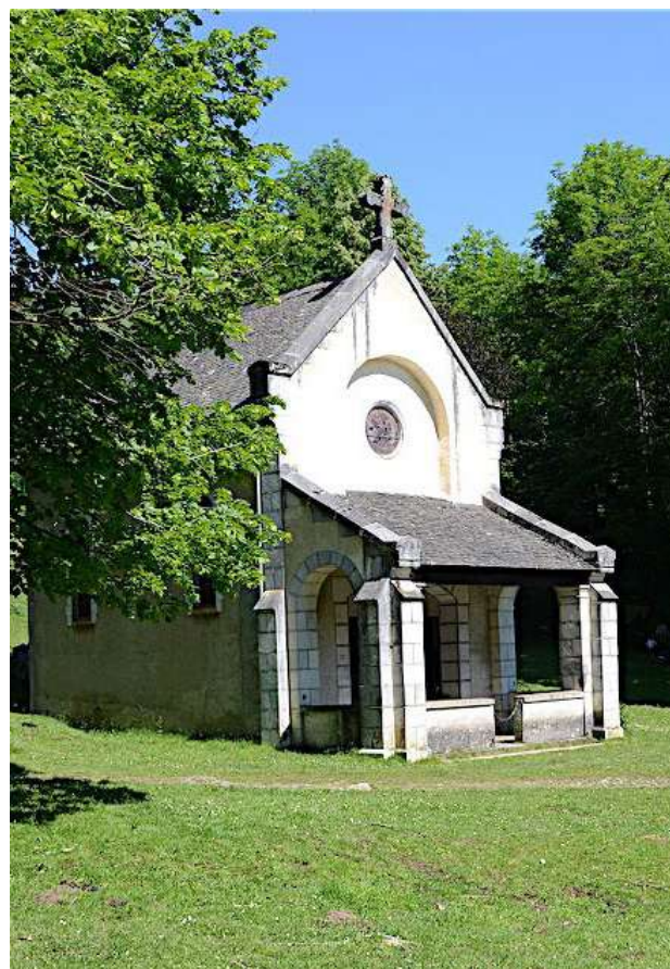
La chapelle de Houndas.

1h05 5 706273 E - 4770253 N Traverser et continuer en face. Le chemin passe entre des clôtures. Laisser un départ de piste sur la droite et continuer par le chemin bordé de noisetiers qui aboutit sur une route. Prendre à gauche, passer la barrière et continuer à descendre jusqu'à la chapelle.