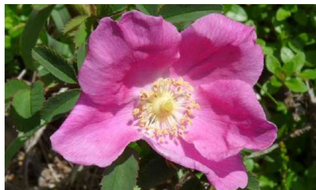
Rosa canina , la rose des pyrénées. Sent délicieusement bon !

5h00 3 711848 E - 4754036 N Prendre à gauche et descendre jusqu'au point 2 , puis à droite jusqu'au pont du Goua. Traverser le pont et prendre à droite pour rejoindre le parking à 50m.