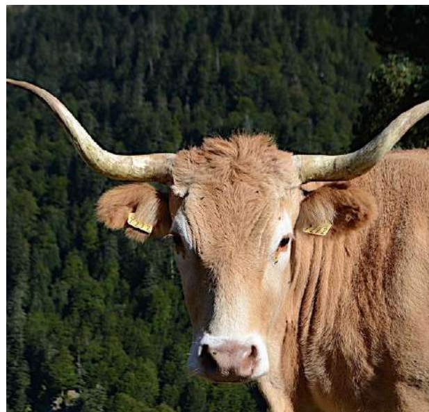
Blonde des Pyrénées.

7 704772 E - 4748308 N Col d'Aas de Bielle 2098m. Le retour s'effectue par le même itinéraire qu'à la montée.