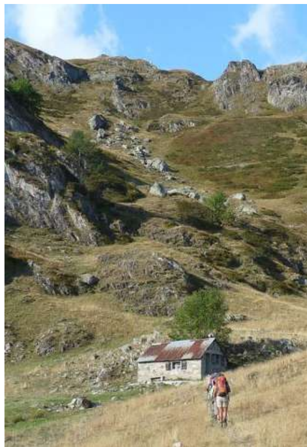
Cabane de Chérue.