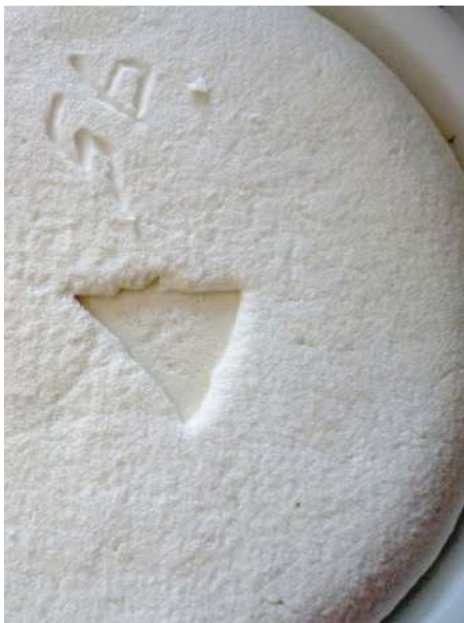
Fromage de brebis.

2h00 4 711890 E - 4747841 N De la cabane de Saoubiste, revenir par le même chemin..