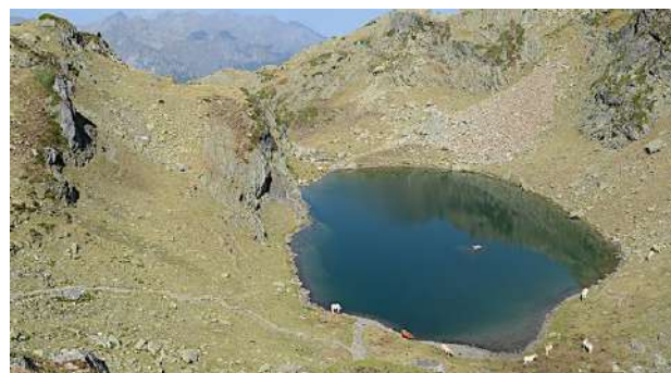
Lac du Lurien.

6 715485 E - 4749279 N Lac du Lurien. Le retour s'effectue par le même itinéraire que la montée.