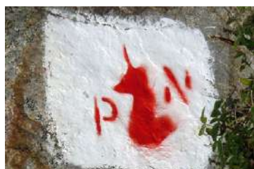
Symbole de limite du parc national.

7 707328 E - 4746900 N En bas de la descente, prendre à droite vers le plateau de Bious que l'on traverse. Au bout, passer un pont à gauche. Prendre à droite, remonter légèrement puis descendre sur la piste qui vous ramène au parking de départ.