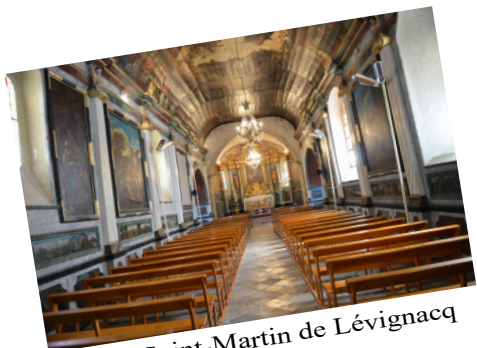
Eglise Saint-Martin de Lévignacq