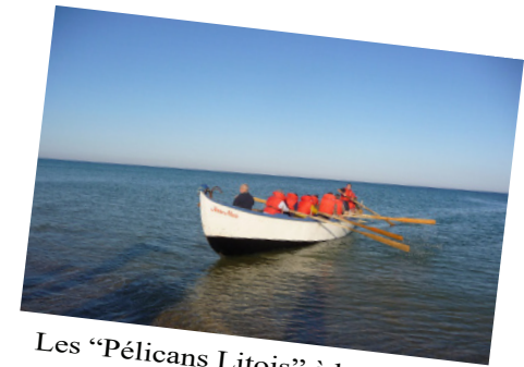
Les "Pélicans Litois" à bord de la pinasse "Anne-Marie"

Le nom, un peu étrange, de cette commune trouve sa source dans le regroupement de deux communes. Lit, qui aurait pour étymologie littus, le rivage, attesterait le fait que la mer était bien plus avancée dans les terres quelques siècles auparavant, quand elle se tient à un peu moins de dix kilomètres aujourd'hui. On soupçonne Mixe, sa jumelle, d'avoir été Mosconum, une antique cité romaine mentionnée dans l'itinéraire d'Antonin. Modestement appelée "La Grande Dame du Marensin", Lit et Mixe et son Cap de l'Homy est une destination phare pour de nombreux surfeurs et s'est construite une solide réputation au fil des années. Le Cap de l'Homy abrite aussi "Anne-Marie", une pinasse qui fait de la résistance à l'heure où ses cousines ont déjà servi de bois de chauffage depuis longtemps. Il s'agit d'une longue barque utilisée traditionnellement pour la pêche, selon une technique particulière appelée « pêche à la pinasse ». Les « Pélicans Litois », une association locale, constitue le dernier équipage de ce fier esquif qui continue à braver les flots au nom du patrimoine.