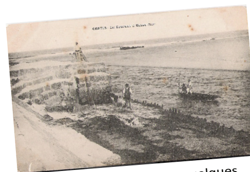
La digue de Contis il y a quelques années...