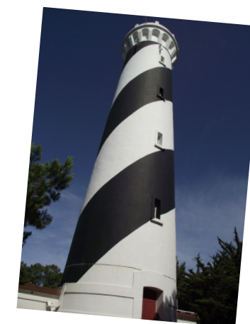
Phare de Contis

Contis est une station balnéaire prisée pour son sable doux et ses dunes sauvages depuis bien longtemps. Les Hospitaliers de l'Ordre de Saint-Jean de Jérusalem, une organisation militaire au même titre que les Templiers, y installèrent une commanderie dès le XV ème siècle, peut-être plus pour des raisons stratégiques que pour exposer leurs armures au soleil. Le phare de Contis est seul à dominer les flots sur toute la côte landaise. Construit en partie en garluche, une pierre riche en fer, il arbore une peinture en spirale de style « barber's pole » comme certains de ses pairs de l'autre côté de l'Atlantique. Il peut être visité et est aujourd'hui entièrement automatisé depuis 1999. Si l'embouchure du Courant de Contis ressemblait à l'origine à celle du Courant d'Huchet, la digue qui y fut construite il y a 70 ans en modifia le tracé durablement.