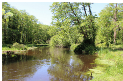
Courant de Contis