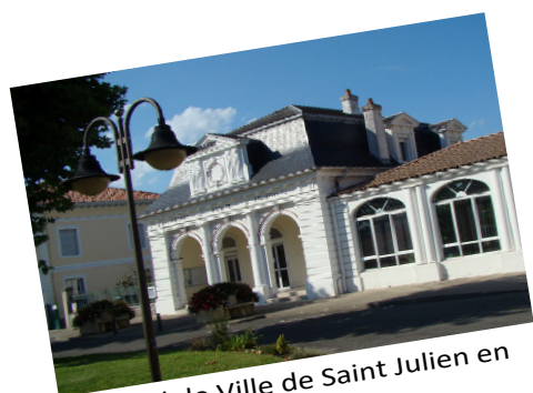
Hôtel de Ville de Saint Julien en Born