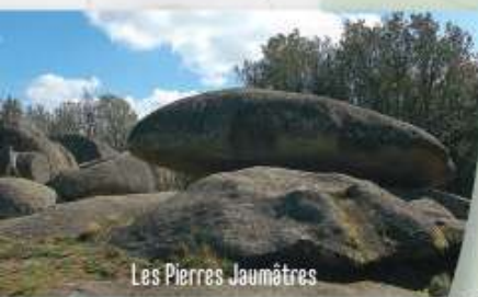
Les Pierres Jaumâtres