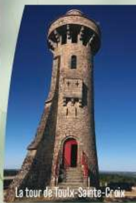
La tour de Toulx-Sainte-Croix