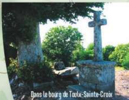
Dans le bourg de Toulx-Sainte-Croix