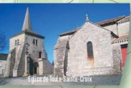
Eglise de Toulx-Sainte-Croix