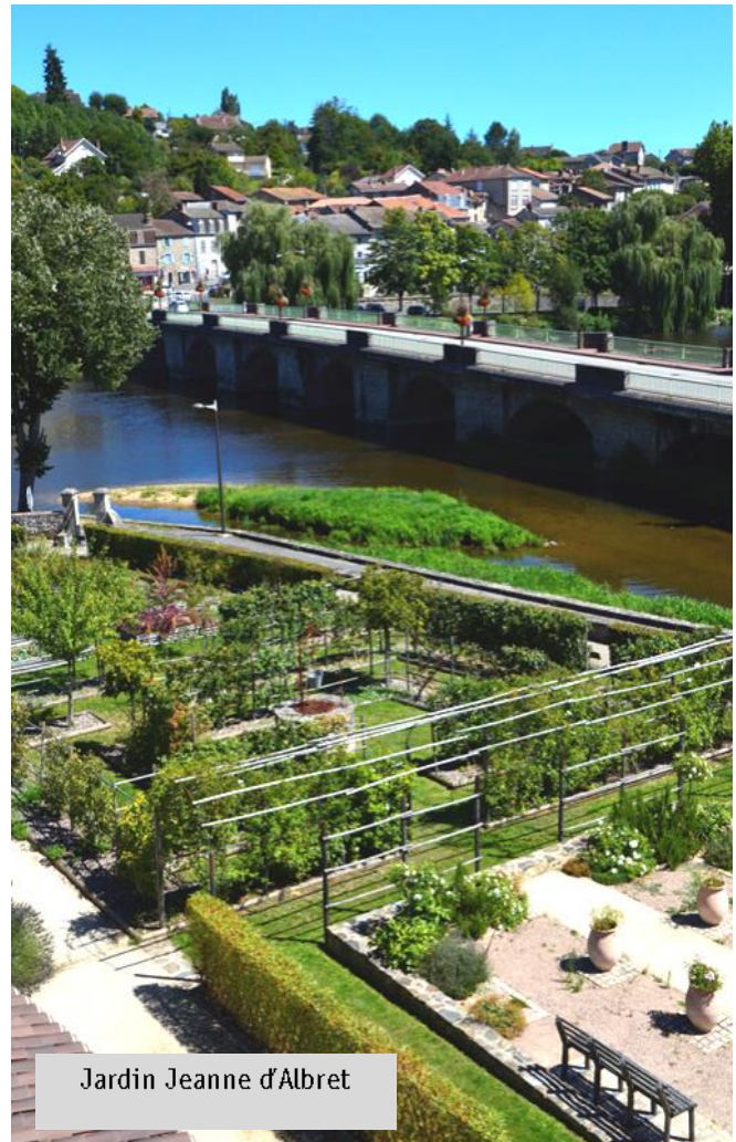
Jardin Jeanne d'Albret