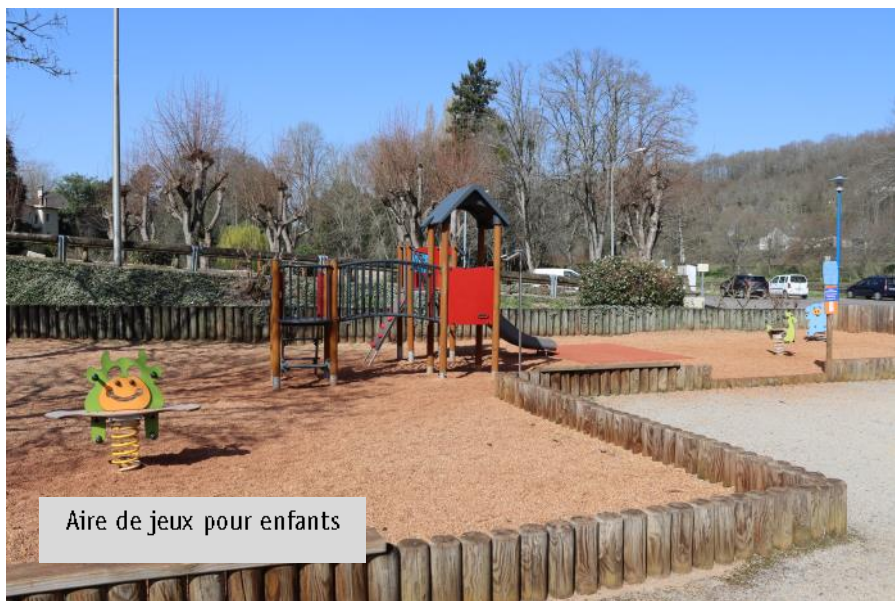
Aire de jeux pour enfants