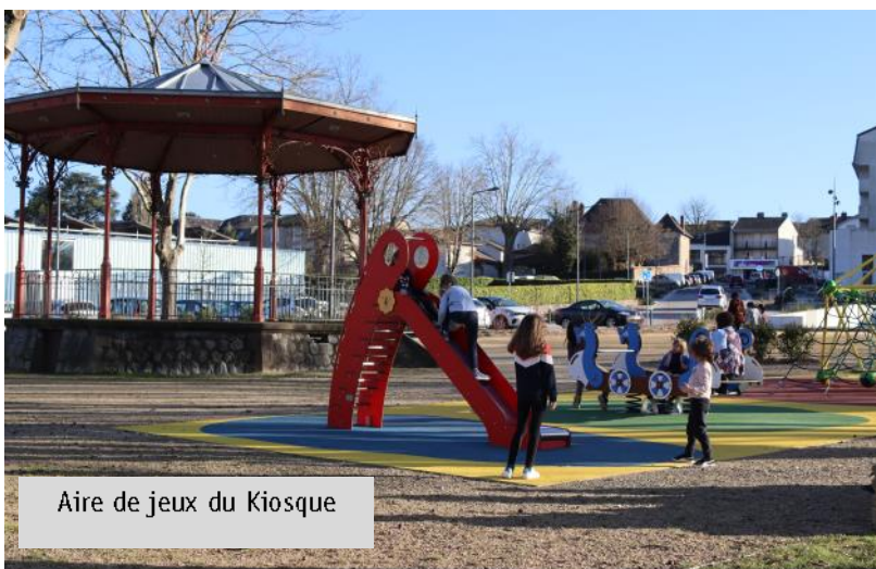
Aire de jeux du Kiosque